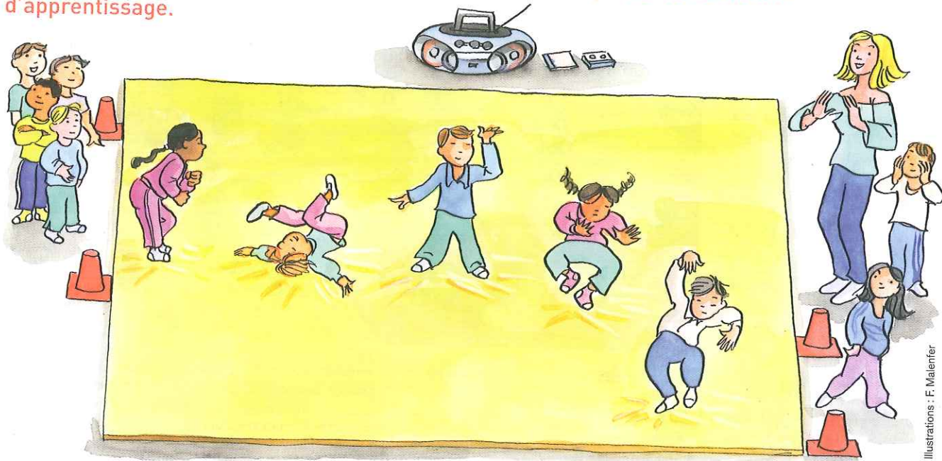
Illustrations : F. Malenfant

Aider l'enfant à construire son savoir danser en sollicitant son imaginaire, sa créativité et structurer son espace de danse sont les objectifs de ce module d'apprentissage.