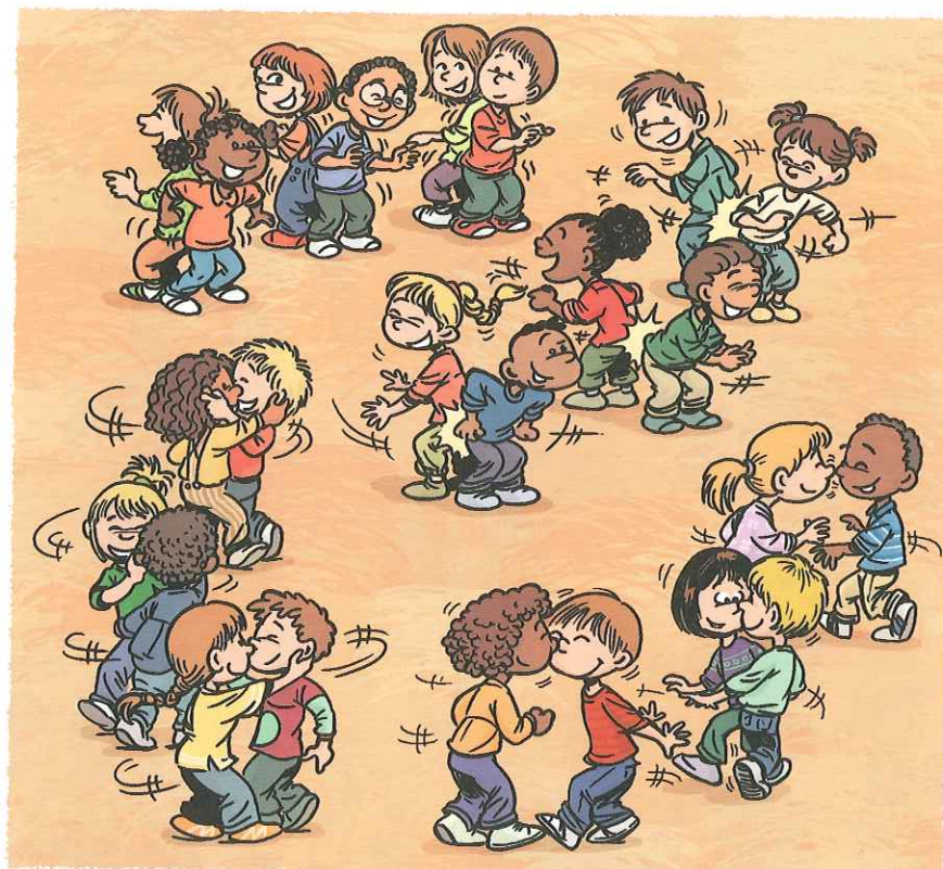
Illustrations : Caro

Voici deux danses pour lesquelles nous présentons des variantes afin de les ajuster aux capacités motrices et cognitives des élèves d'école maternelle. En conservant une structure de danse identique, on offre la possibilité de faire danser des élèves d'âges différents dans un même moment de plaisir. •