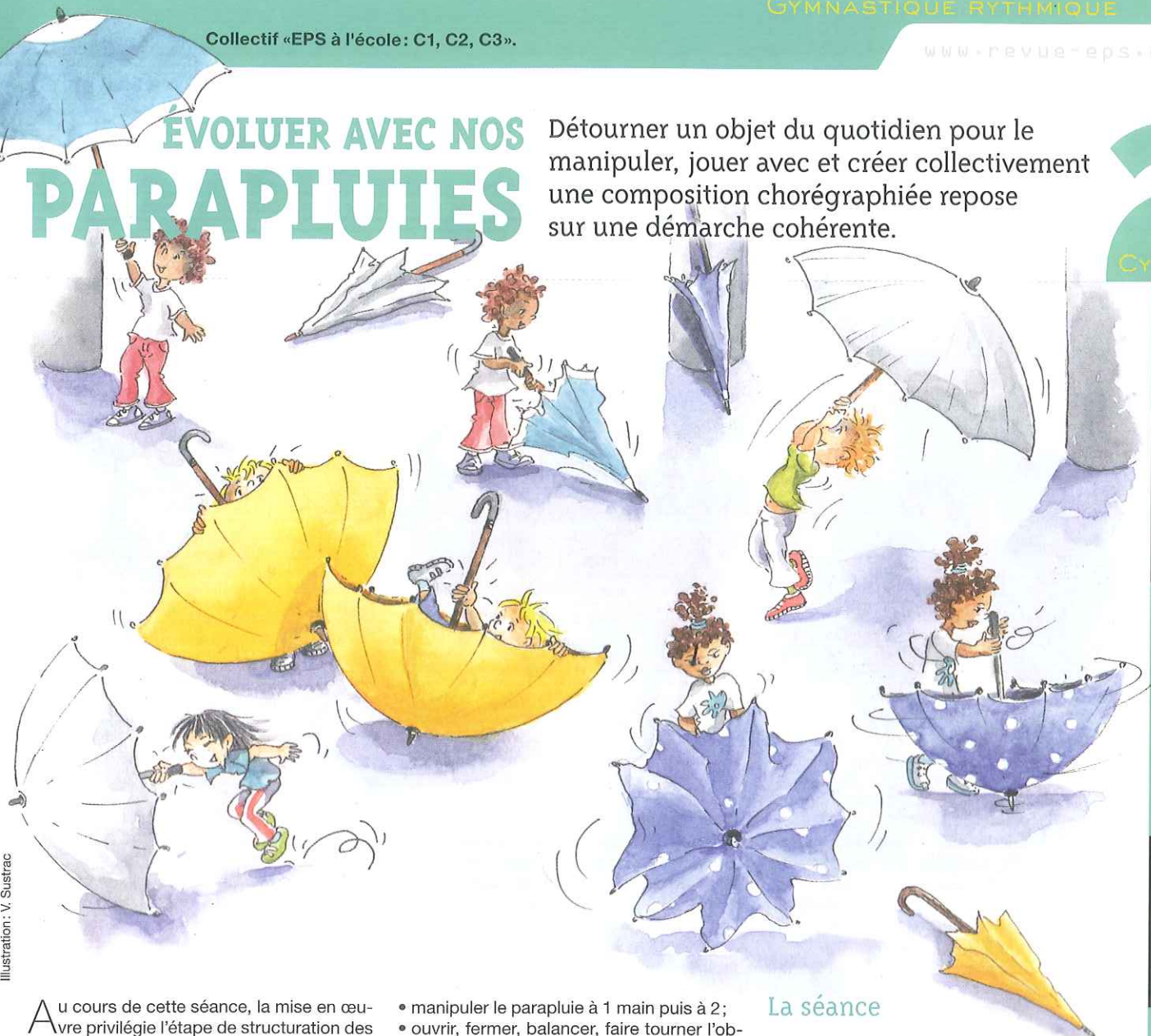
Illustration: V. Sustrac

Au cours de cette séance, la mise en œuvre privilégie l'étape de structuration des acquisitions pour amener ensuite les élèves à investir et construire progressivement un véritable projet d'action. Il est intéressant de confronter les enfants à plusieurs dispositifs, travail individuel, à 2, 3 ou plus, avec des temps d'observation pour enrichir les situations motrices vécues. Dans tous les cas, il est important que chaque élève ait le même temps de pratique.