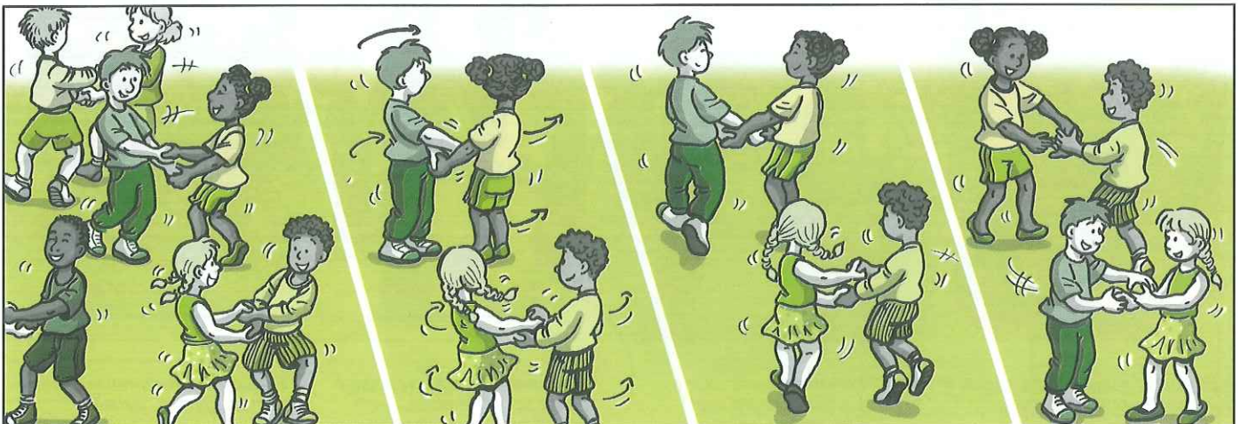
Mon papa est cordonnier Ma maman fait des souliers Ma petite sœur est demoiselle