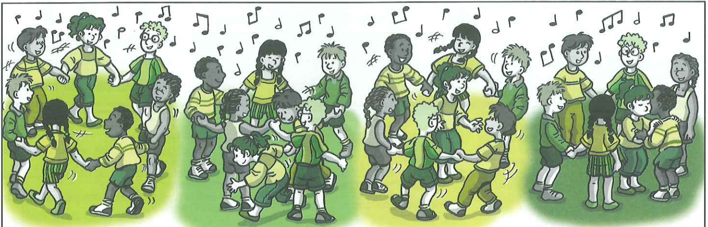
La plus gentille à marier Je vais vous la présenter