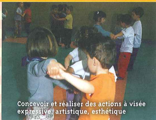
Concevoir et réaliser des actions à visée expressive, artistique, esthétique