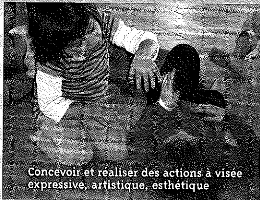
Concevoir et réaliser des actions à visée expressive, artistique, esthétique